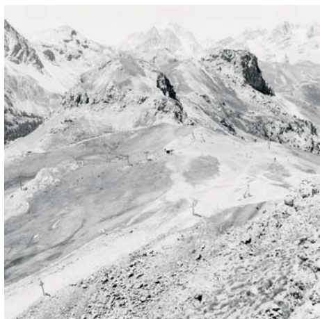
Vue de la crête du rocher blanc, au premier plan le télésiège du serre blanc et le télésiège du rocher blanc, Briançon, Hautes Alpes, 5 juillet 2000.

Extraits des articles de Philippe Arbaïzar, conservateur en chef des bibliothèques et d'Isabelle Ewig, maître de conférences à l'université de la Sorbonne.