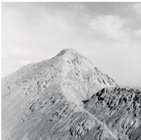
Massy, Essonne, 14 juillet 1997.