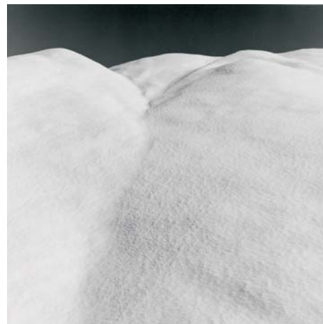
Mont Dauphin, Hautes Alpes, 31 janvier 1999.

Que représentent ces images, des montagnes ou peut-être des dunes ? Certaines vues ont été prises dans les Hautes Alpes, d'autres sont réalisées en Essonne, ce qui n'est pas sans jeter un doute sur la justesse du référent auquel on avait pensé d'emblée. Un parfait cadrage découpe l'image pour tromper, une ligne de cimes se détache sur le ciel, un nuage vient habilement créer l'illusion, explique Philippe Arbaïzar.