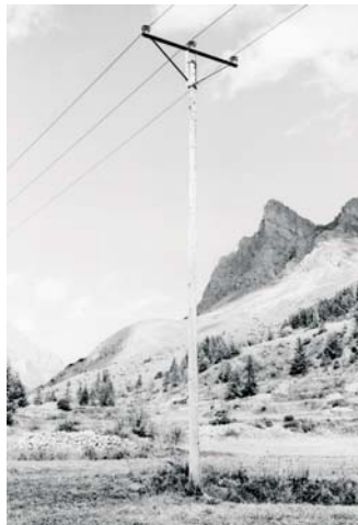
Au-dessus du Lauzet, col du Lautaret, Hautes Alpes, 8 octobre 2001