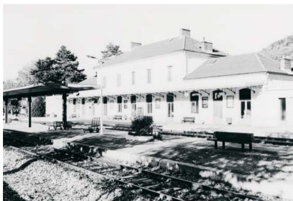
Gare de Veynes-Dévoluy, Hautes Alpes, 2 novembre 2003.