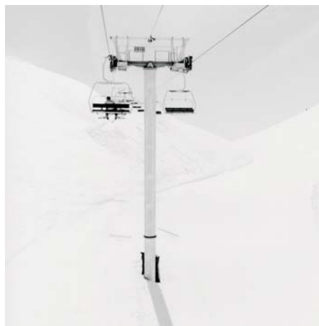
Télesiège de l'Eychauda, le Monétier les Bains, Hautes Alpes, 31 mars 2001.