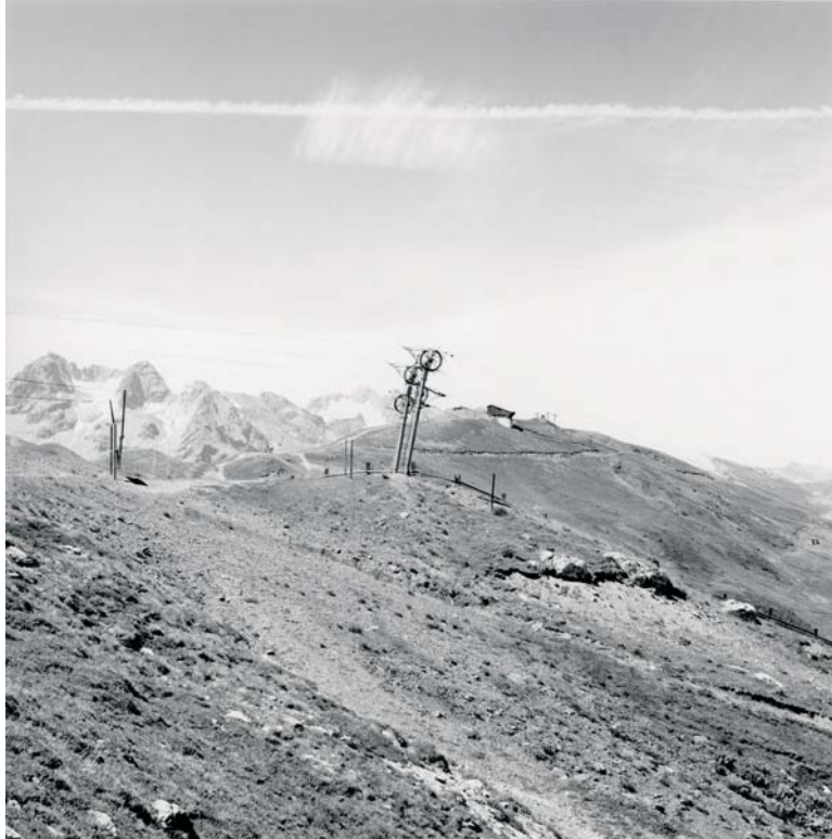
Téleski du bois des coqs, Chantemerle, Hautes Alpes, 27 juillet 2000.