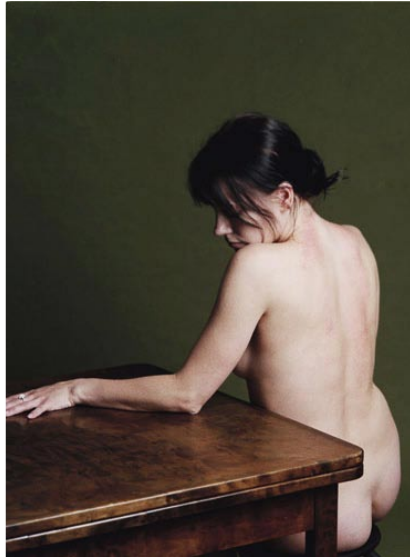
Woman with a rash at table, 2004