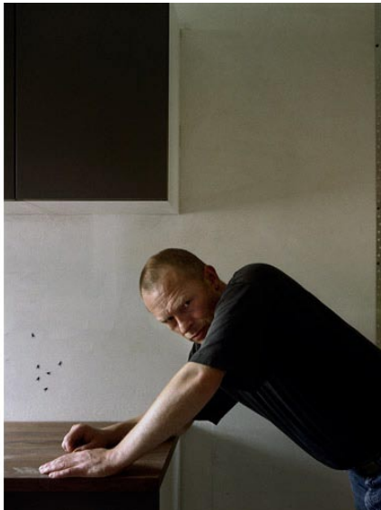
Man leaning at table, 2004