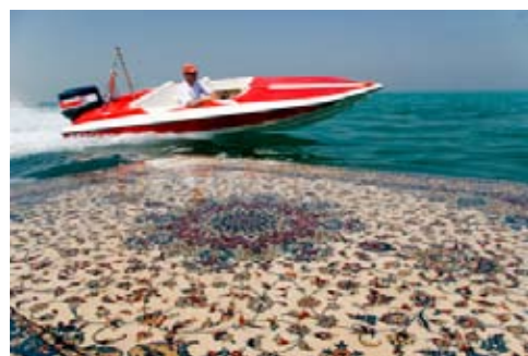
Jalal Sepehr, from the series Water & Persian Rugs, 2004