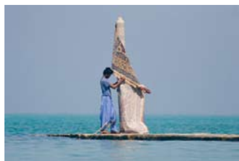
Jalal Sepehr, from the series Water & Persian Rugs, 2004