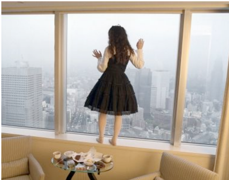
Mario A., The World Is Beautiful , #9, 2005