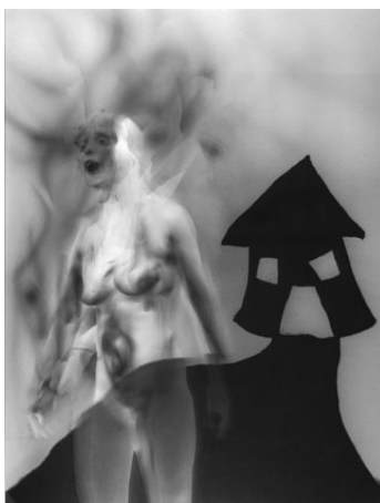
Photographie 32, 2006