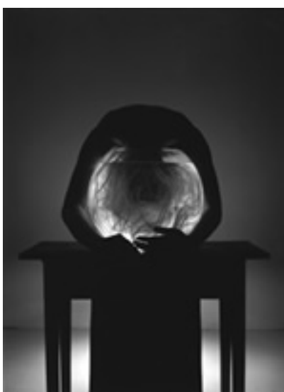
Aqua bon, 2006