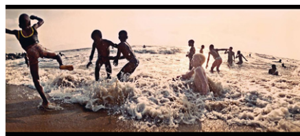
La plage à Kribi.