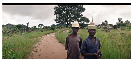
Près de Membza, Monts du Mandara.