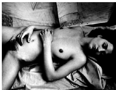
Peter Suschitzky, Elisa , 2008