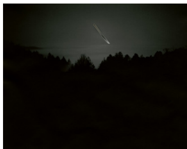
Chris McCaw, Sunburned # 252 , 2008

L'utilisation des visuels est exclusivement réservée à la promotion de l'exposition. Mention obligatoire : © courtesy Galerie Esther Woerdehoff, Paris