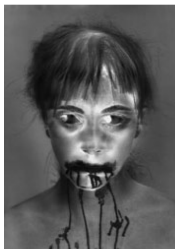
C'est pour rire n°3, 2007