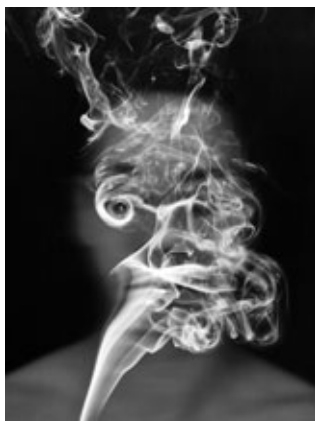
Feue la Lo n°5, 2007