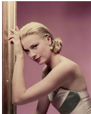
Erwin Blumenfeld, Grace Kelly, Cosmopolitan, Avril 1955