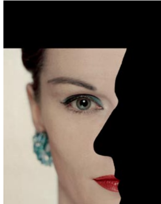
Erwin Blumenfeld, Publicité pour les parfums Dana, vers 1950