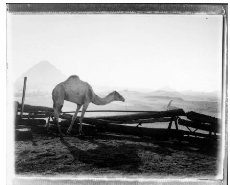
Monique Jacot, Sakkarah Courtesy Galerie Esther Woerdehoff, Paris

Contact presse : Beatrice Rossetto Tél : +33 1 43 21 44 83 Fax : +33 1 43 21 45 03 galerie@ewgalerie.com