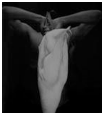
Mario Cravo Neto, Sacrifice 7