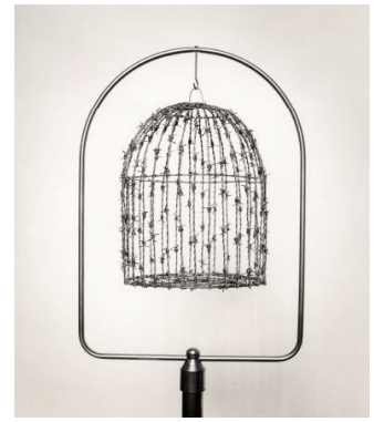
Chema Madoz, Jaula-alambre