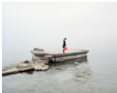
© Loan Nguyen « Marée Haute » 2008