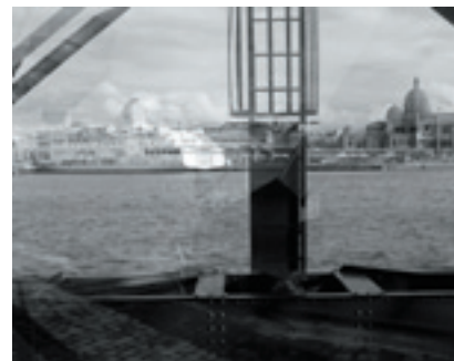
© Rémi Guerrin « Marseille, France » 2008

Pour toute demande de visuel, veuillez contacter Scarlett Greco : presse@ewgalerie.com