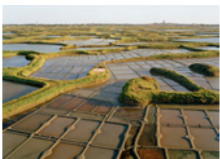
© Matthias Koch « Salzfelder » 2006