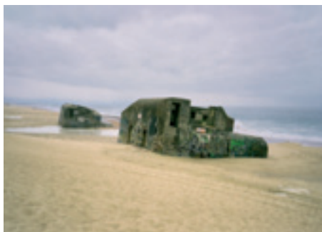
© Philippe Calandre « Bunker, France » 2002