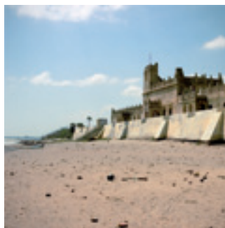
© Didier Cholodnicki « Tranquebar, India » 2007