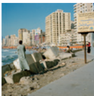
© Brigitte Bauer « Alexandria, Egypt » 2005