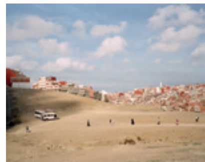
© Sylvain Duffard « Tanger, Marocco » 2008